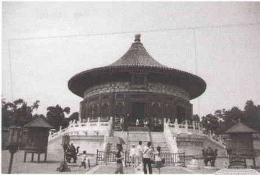
▲北京天坛公园 皇穹宇近景