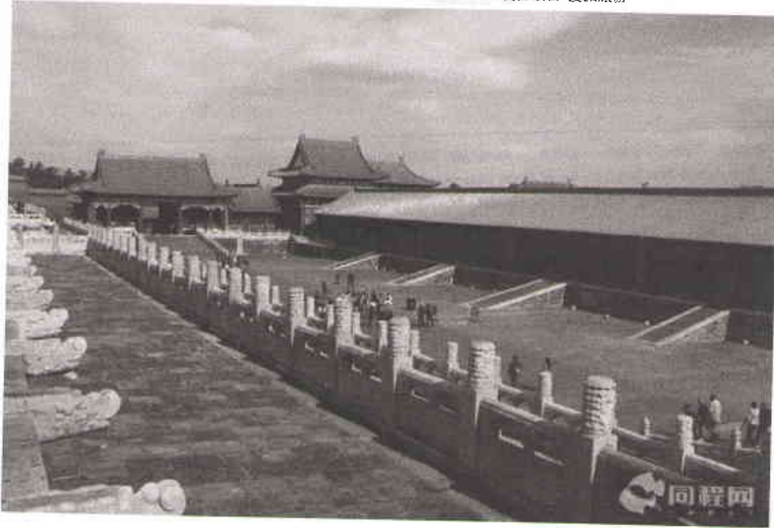
中和殿，皇帝在升太和殿举行大典前，先在此暂憩，并接受执事官员的朝拜。或于亲祭等大礼前在此检阅祝文、奏书之类的准备工作。